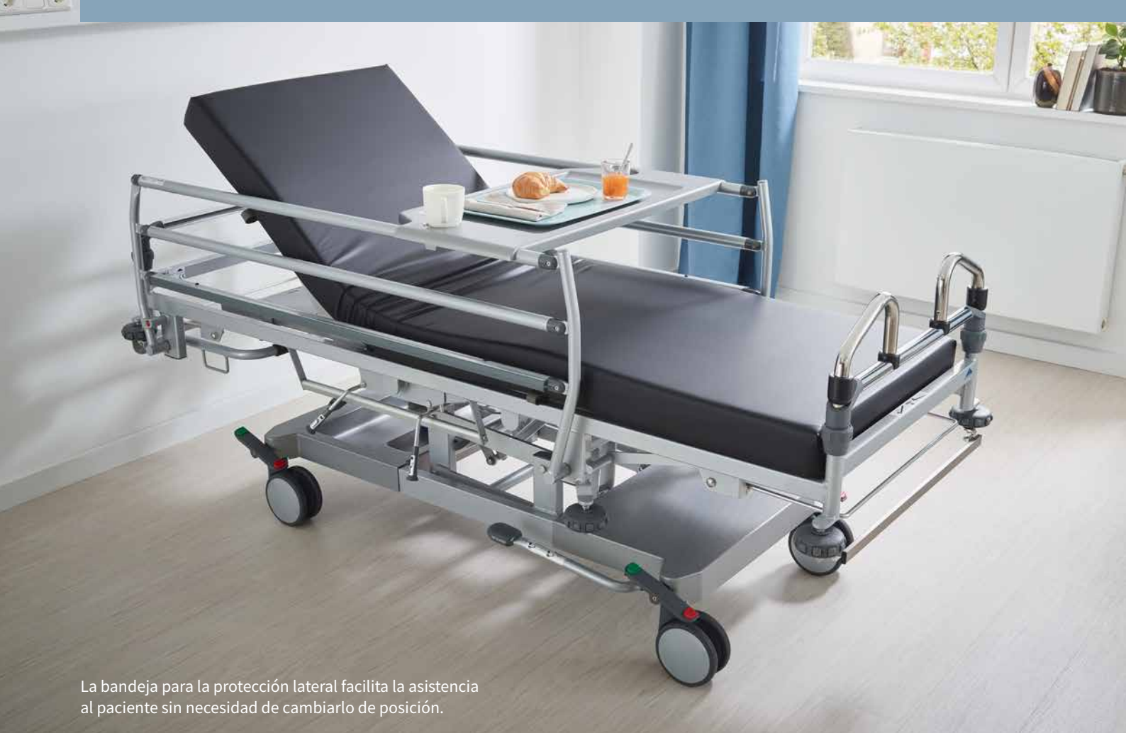
La bandeja para la protección lateral facilita la asistencia al paciente sin necesidad de cambiarlo de posición.