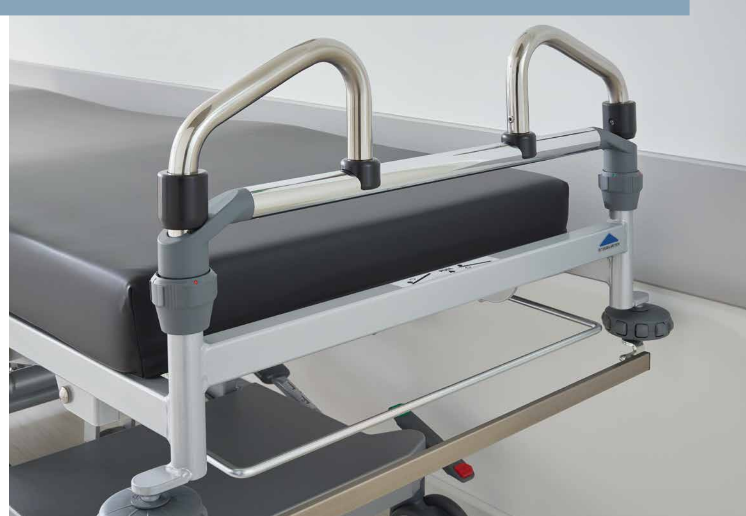
▲ Los anchos asideros de empuje con forma ergonómica en el extremo del cabecero o del piecero permiten maniobrar la camilla de forma ágil y rápida.