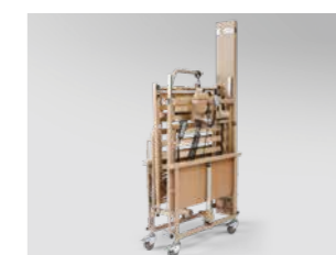
Platzsparende Auslieferung und Lagerung auf Lager-/Transporthilfe (Abb. ähnlich)