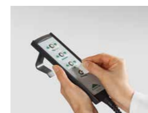
Handschalter mit selektiver Sperrfunktion