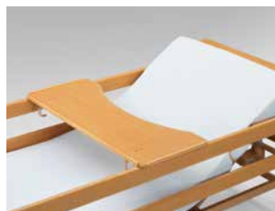
Servierblech für Allura II 100