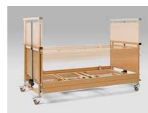
Verstellbereich von 30 bis 80 cm