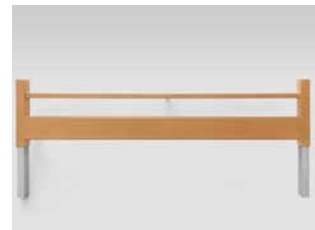
Bettverlängerung (auch nachträglich montierbar)