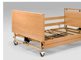
Holzfüllung zur Verkleidung des Fahrgestells (auch nachträglich montierbar)