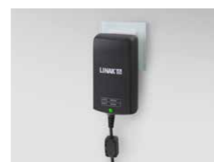
Elektronisches Schaltnetzteil (Switch Mode), direkt hinter Netzstecker integriert