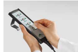
Handschalter mit selektiver Sperrfunktion.