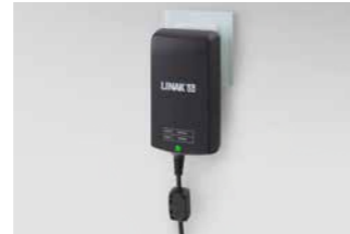
Elektronisches Schaltnetzteil (Switch Mode), direkt hinter Netzstecker integriert.