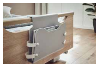
Der Journalhalter eignet sich für medizinische Dokumente oder Zeitschriften.