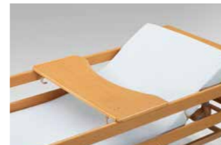
Serviertablett für Allura II 100.