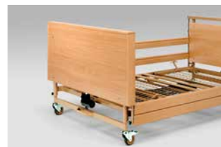
Holzfüllung zur Verkleidung des Fahrgestells (auch nachträglich montierbar).