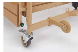
Wandabweisrolle inkl. Halterung.