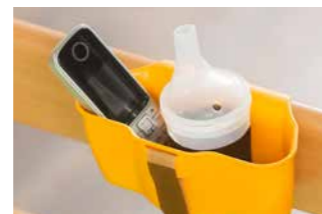
Die Aufnahmeschale für Brillen, Handys oder den kabellosen Handschalter lässt sich an vielen Stellen einfach anbringen.