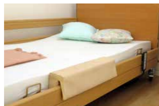
Füllpolster zum Aufstecken auf die durchgehende Seitensicherung.