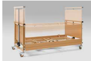
Verstellbereich von 30 bis 80 cm.