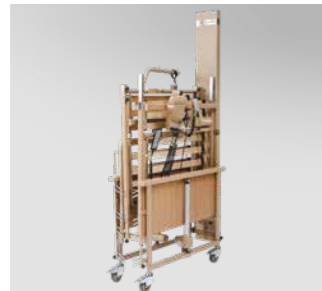
Platzsparende Auslieferung und Lagerung auf Lager-/Transporthilfe (Abb. ähnlich).