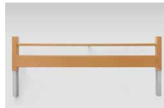
Bettverlängerung (auch nachträglich montierbar).