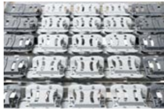
9 10 Die Komfortliegefläche besteht aus 50 freischwingenden Federelementen.