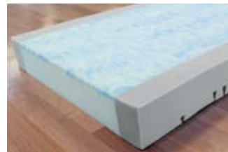
20 Pflegebettmatratze Sky-fit.