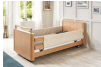
14 Schaumlederbezug für DSG.