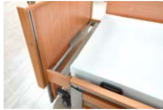
2 3 Bettverlängerung.