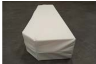
13 Polsterteil für Bettverlängerung.