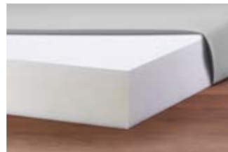
22 Pflegebettmatratze Basic-fit.