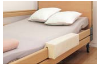
6 Das Füllpolster lässt sich auf die durchgehende Seitensicherung stecken und erleichtert das Sitzen auf der Bettseite.