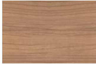
5 Dekor Kirsche Havanna.