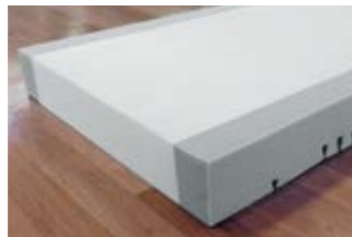
21 Pflegebettmatratze Comfort-fit.