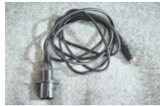
8 Verlängerungskabel für den Handschalter (1,40 m).