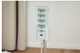
7 Flexibler Geberhalter für den Handschalter.