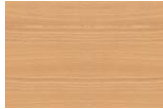
4 Dekor Buche Natur.