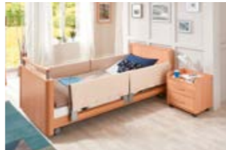
15 Schaumlederbezug für TSG.