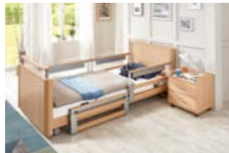
17 18 Teleskopierbare Seitensicherung (TSG).