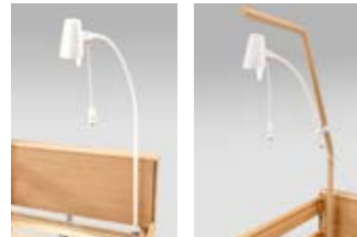
11 12 Leselampe Sola.