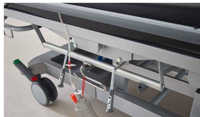
▼ Parien alla olevassa telineessä on tilaa happipulloverille ja kiinnityshihnalta sekä potilaan henkilökohtaisille tavaroille.

▼ Tärkeitä hoitovälineitä voidaan kiinnittää Mobilon molemmille puolille ja joustavasti tarpeen mukaan varustekiskoihin.