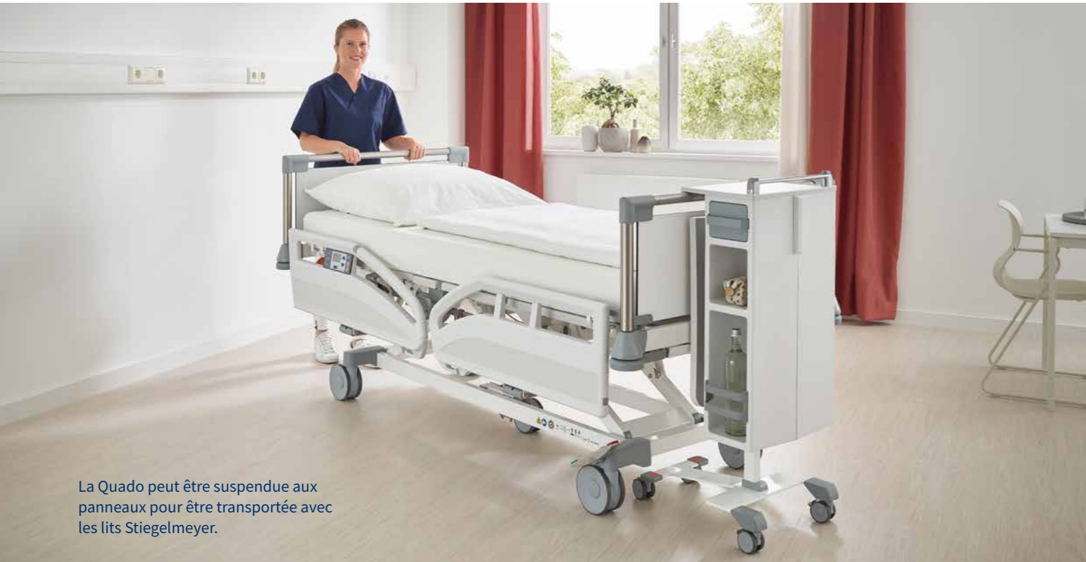
La Quado peut être suspendue aux panneaux pour être transportée avec les lits Stiegmeyer.