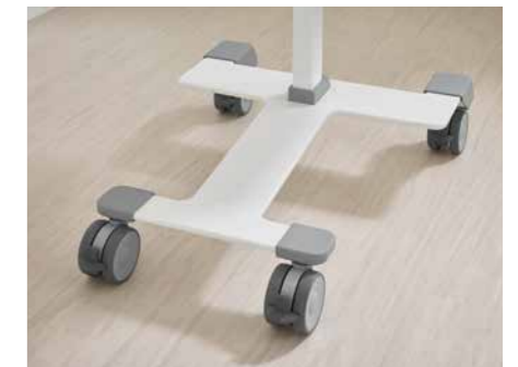
▲ Het onderstel zorgt voor een hoge stabiliteit en is eenvoudig te reinigen.

De Quado is machinewasbaar en kan ook snel met de hand worden gereinigd. Dit zorgt voor een optimale hygiëne in het ziekenhuis.