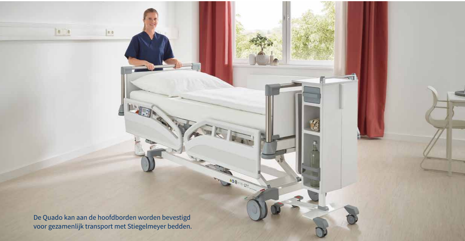
De Quado kan aan de hoofdborden worden bevestigd voor gezamenlijk transport met Stiegemeyer bedden.