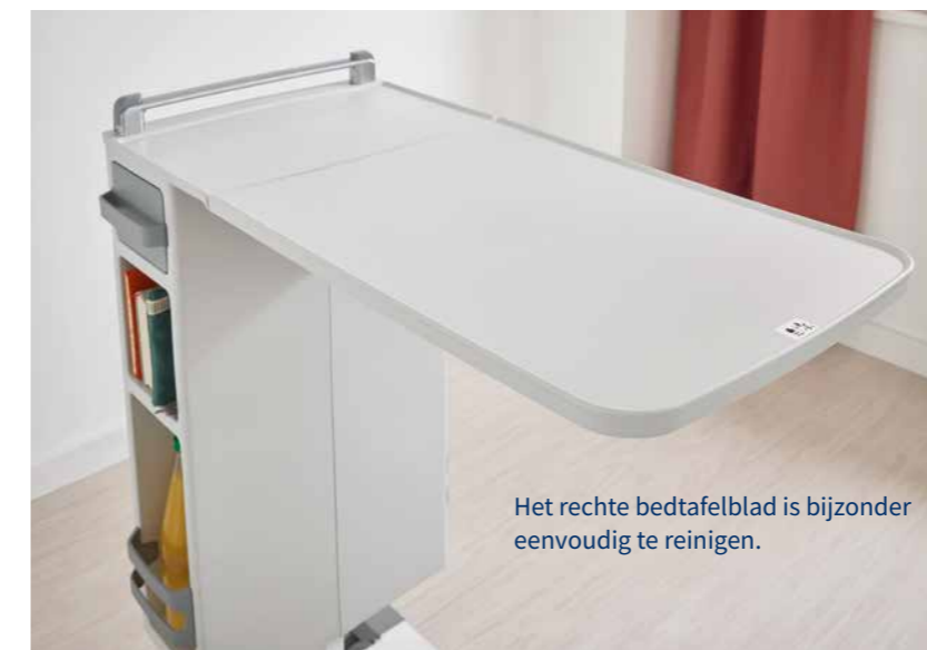
Het rechte bedtafelblad is bijzonder eenvoudig te reinigen.