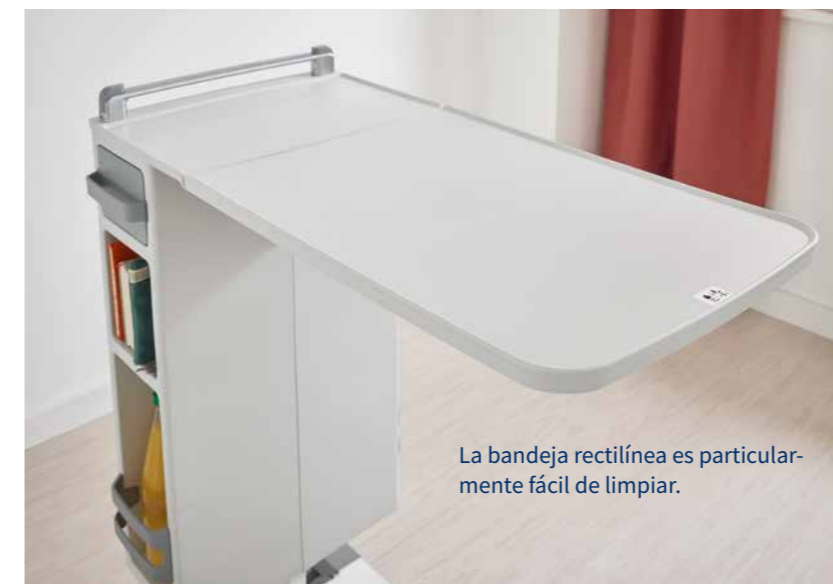
La bandeja rectilínea es particularmente fácil de limpiar.