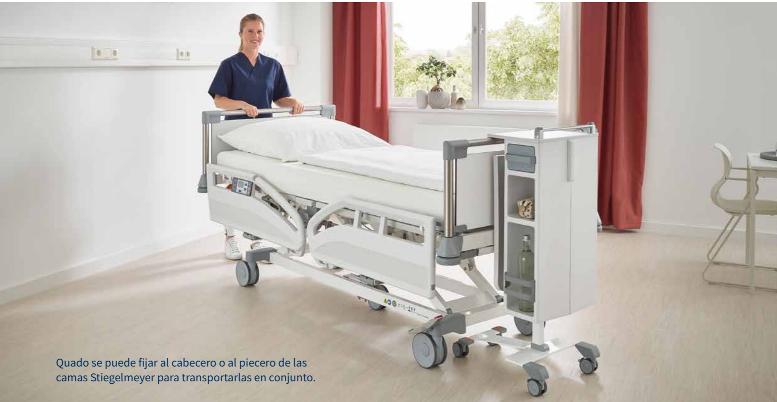
Quado se puede fijar al cabecero o al piecero de las camas Stiegmeyer para transportarlas en conjunto.