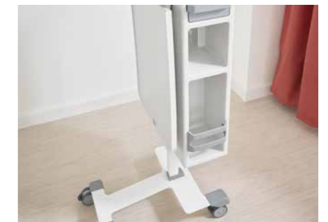
▶ Las formas, que facilitan la limpieza, aportan a Quado magníficas propiedades de higiene.