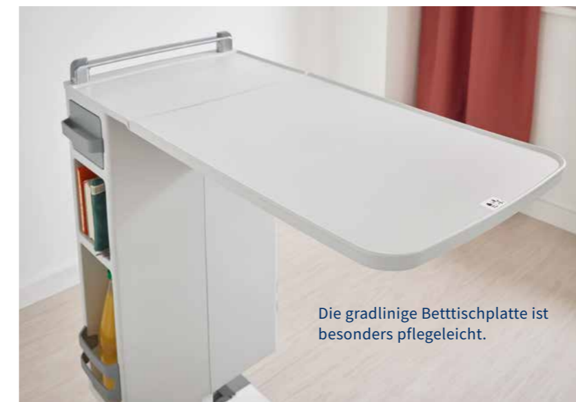
Die gradlinige Bettischplatte ist besonders pflegeleicht.