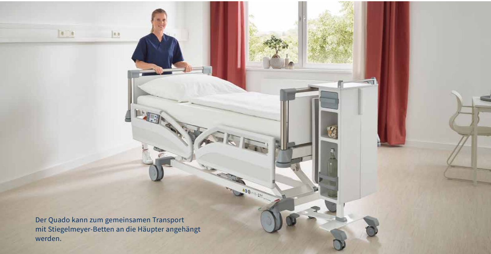
Der Quado kann zum gemeinsamen Transport mit Stieglmeyer-Betten an die Häupter angehängt werden.