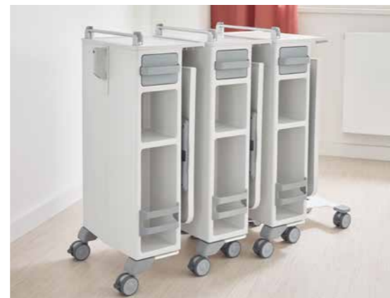
Die Quado-Nachttische lassen sich zum Lagern platzsparend ineinander schieben.

über Schwellen oder bei Hindernissen sollte er über die Höhenverstellung des Bettes angehoben werden. Ist der Quado am Zielort angekommen, lässt er sich dank seiner bremsbaren Rollen sicher neben dem Bett platzieren.