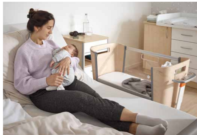
▲ De Jovie kan versteld worden om precies bij elke bedhoogte te passen - altijd gelijk met het ligvlak van de moeder.