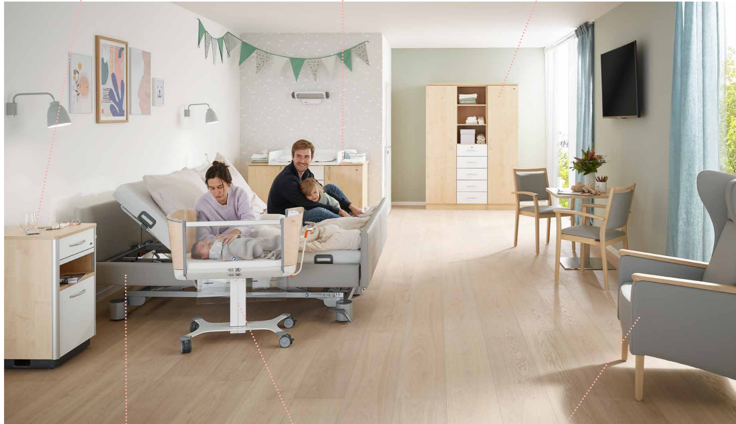
Tweepersoonsbed Libra partner