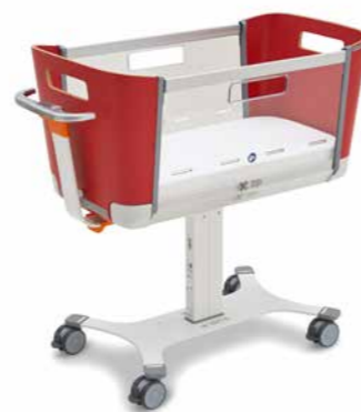
▲ Kleurrijk ontwerp: Rood