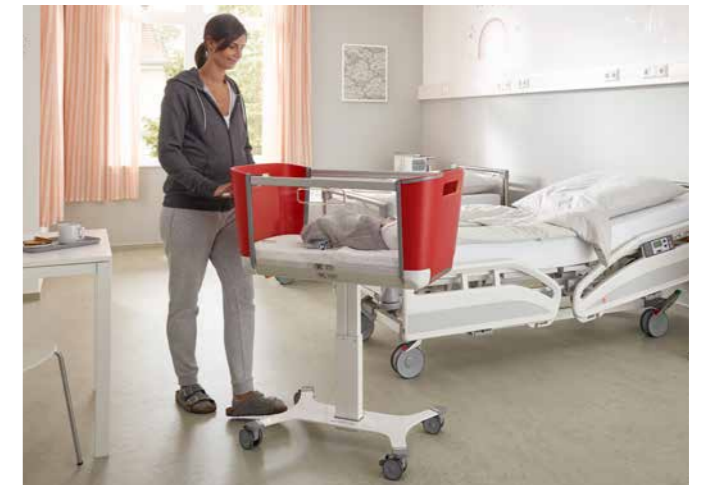
▲ Een rustig ritje voor de baby: moderne dubbele zwenkwieën met een zachte loop beschermt de kleine passagier tegen schokken. 4 afzonderlijke remmen geven de Jovie een veilige grip.