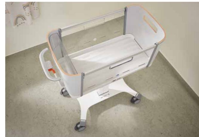
▲ Veilige hygiëne is van cruciaal belang voor de baby. Het vlakke ontwerp van de Jovie zonder nissen maakt handmatig schoonmaken veel gemakkelijker.

Een licht verhoogde positie van het bovenlichaam, bijvoorbeeld door de baby na de borstvoeding in een anti-Trendelenburg-positie te plaatsen, kan helpen bij refluxklachten.