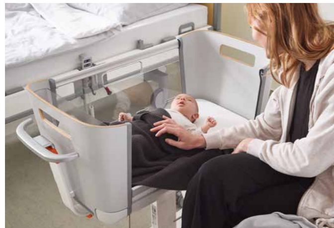
▲ Enerzijds biedt de Jovie de pasgeborene de geborgenheid van zijn eigen bedje, anderzijds is lichamelijk contact met de moeder op elk moment mogelijk.