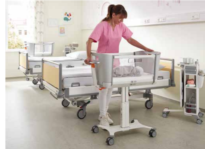
▲ De kraamhulp kan de hoogte van de bak traploos instellen met een hendel op de duwbeugel. De stille ondersteuning van de gasdrukveer maakt de baby niet wakker.