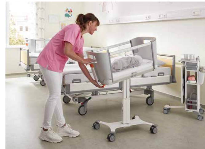
▲ Als de baby de eerste dagen last heeft van reflux, kan de anti-Trendelenburg-positie tot ca. 13° snel verlichting bieden. Ook deze positie kan zachtjes worden aangepast met behulp van een gasdrukveer.