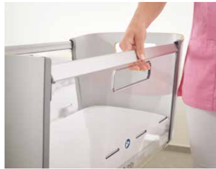
▲ De zijpanelen kunnen eenvoudig bediend worden,.

Onze Jovie bevordert de hechtingsfase direct na de geboorte. Ontwikkelingsdeskundigen gaan ervan uit dat moeder en kind in deze periode bijzonder gevoelig zijn en dat het intensieve fysieke contact een blijvend effect heeft op de relatie tussen beiden. Het babybed Jovie kan aan beide kanten geopend worden, afhankelijk van de positie. Dit creëert een ligvlakverbinding met het bed van de moeder.