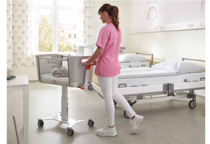
▲ Dankzij de goede rijeigenschappen manoeuvreert de kraamhulp het babybedje Jovie snel en moeiteloos naar elke gewenste locatie.