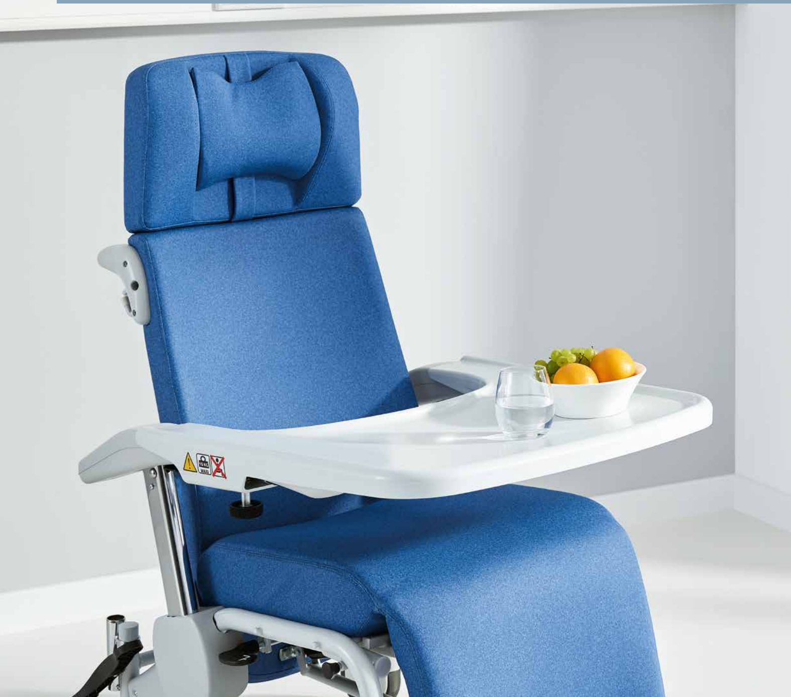
▲ La bandeja de servicio opcional puede acoplarse fácilmente a los reposabrazos.