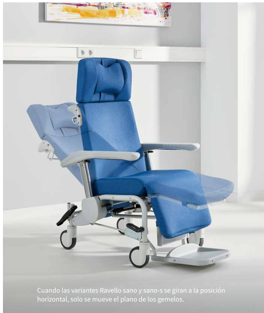
Cuando las variantes Ravello sano y sano-s se giran a la posición horizontal, solo se mueve el plano de los gemelos.