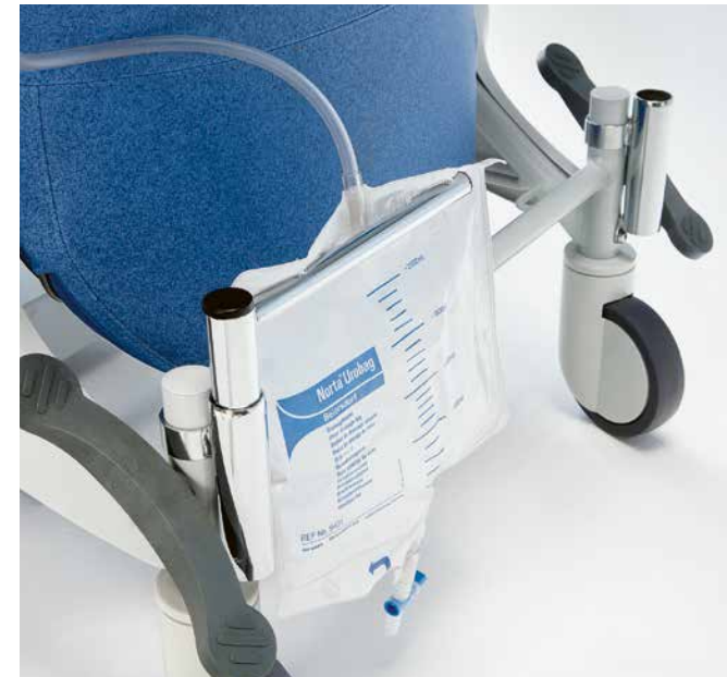
▲ Hay disponible un soporte opcional para una bolsa de drenaje.