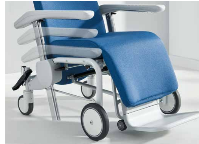
▲ Los reposabrazos abatibles permiten acceder sin impedimento desde delante y desde el lateral.