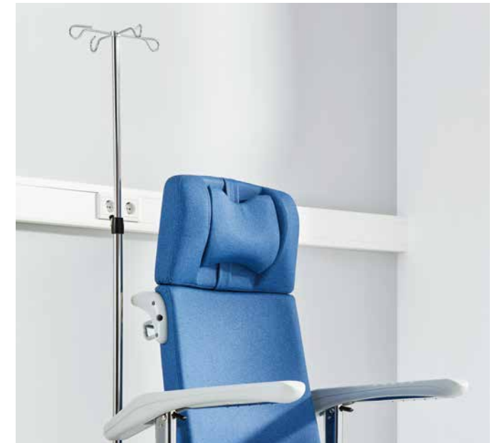
▲ Los pies de gotero pueden encajarse a ambos lados en los casquillos de serie.