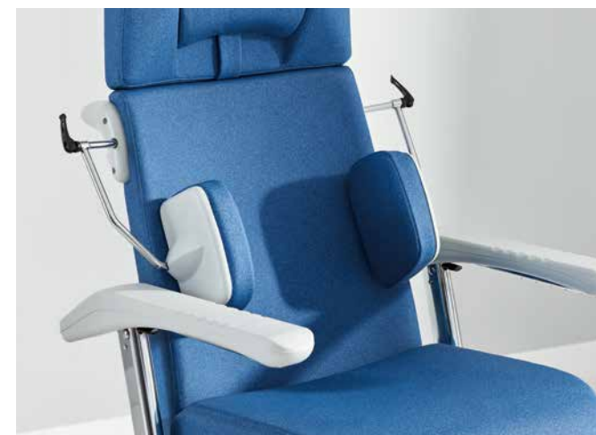
▲ Los apoyos laterales opcionales favorecen una postura erguida al estar sentado.

Una versión estándar bien dotada y accesorios innovadores transforman la Ravello en una silla de transporte en la que disfrutar del tiempo, p. ej., mientras se come. Además, los dispositivos auxiliares médicos pueden fijarse a la Ravello de un modo seguro y discreto. Todas las variantes del modelo están disponibles en azul (cobalto) brillante. El acolchado es resistente a los productos de desinfección estándar empleados en el hospital (concentración según la lista BGHM).