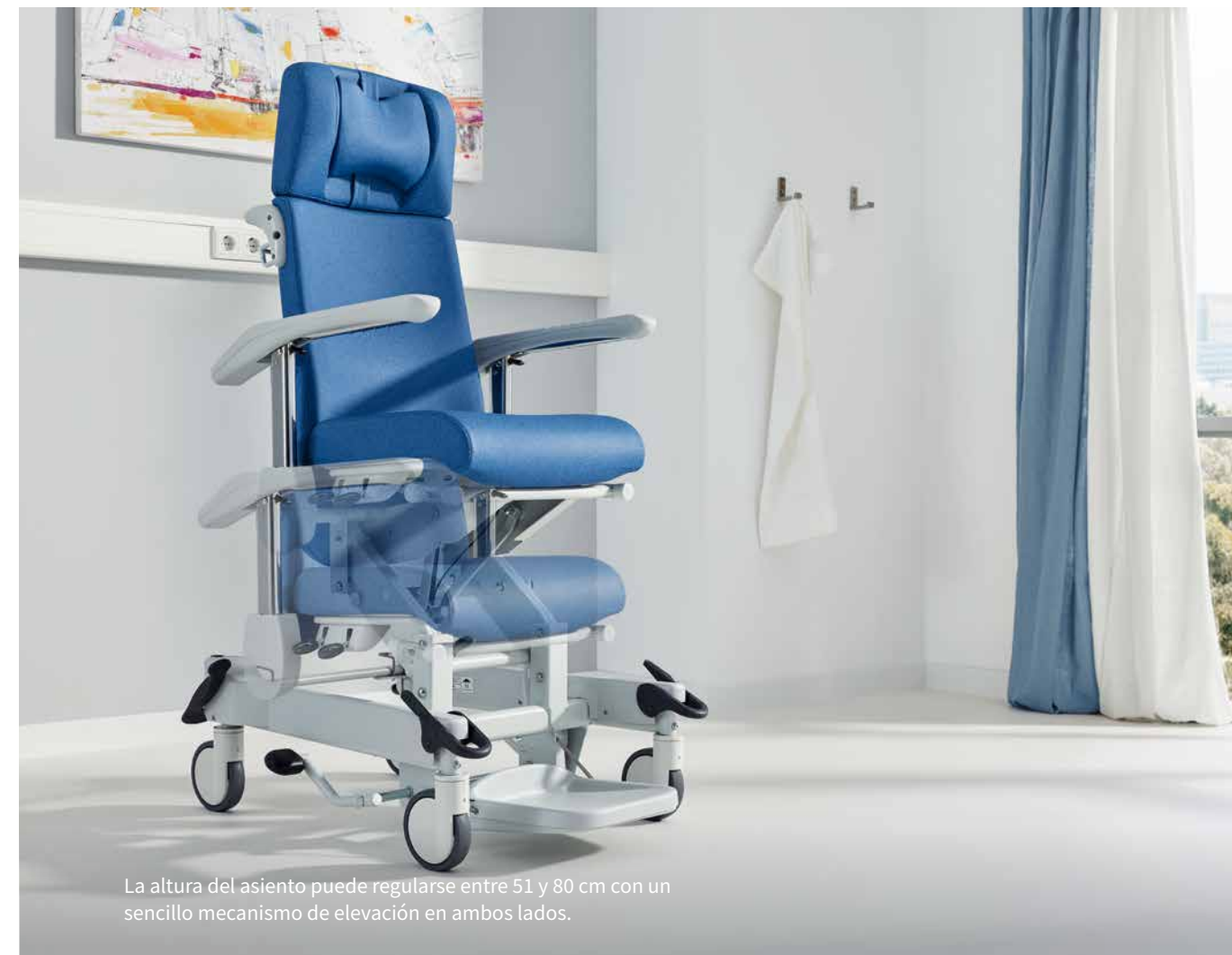
La altura del asiento puede regularse entre 51 y 80 cm con un sencillo mecanismo de elevación en ambos lados.

La «s» de los modelos Ravello sano-s y Ravello plus-s significa «Simple Move», movimiento sencillo. Estos modelos están provistos de 4 ruedas direccionables móviles con un diámetro de 125 mm o 150 mm. Gracias a esta característica, las sillas pueden dirigirse sin esfuerzo e incluso maniobrarse en espacios sumamente estrechos sin chocar. Esto protege a los pacientes o residentes y evita daños en las sillas y la decoración de la habitación.