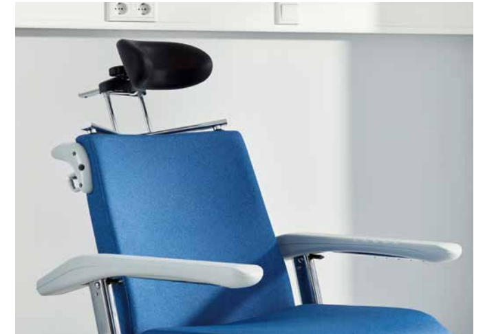
▲ Si el usuario necesita una sujeción adicional cuando está sentado, puede optarse por un apoyo para fijar la cabeza.