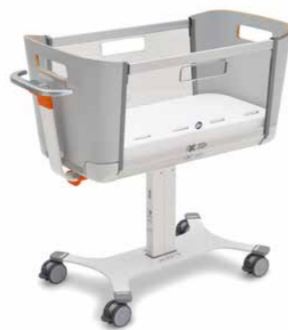
▲ Neutralny design: szary lakier