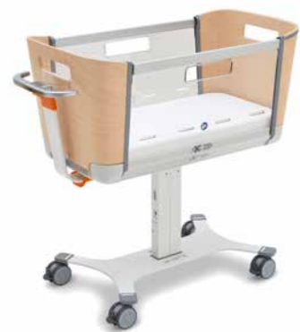
▲ Przytulny design: drewno bukowe, bezbarwny lakier

Dzięki atrakcyjnym opcjom kolorystycznym i nowoczesnemu wzornictwu, łóżeczko Jovie staje się również wizualnym autem każdego oddziału szpitalnego.