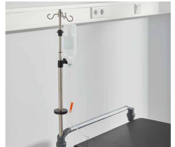
▲ Der teleskopierbare Infusionsständer für den Stretcher Mobilo wird optional platzsparend am Fußende verstaut.