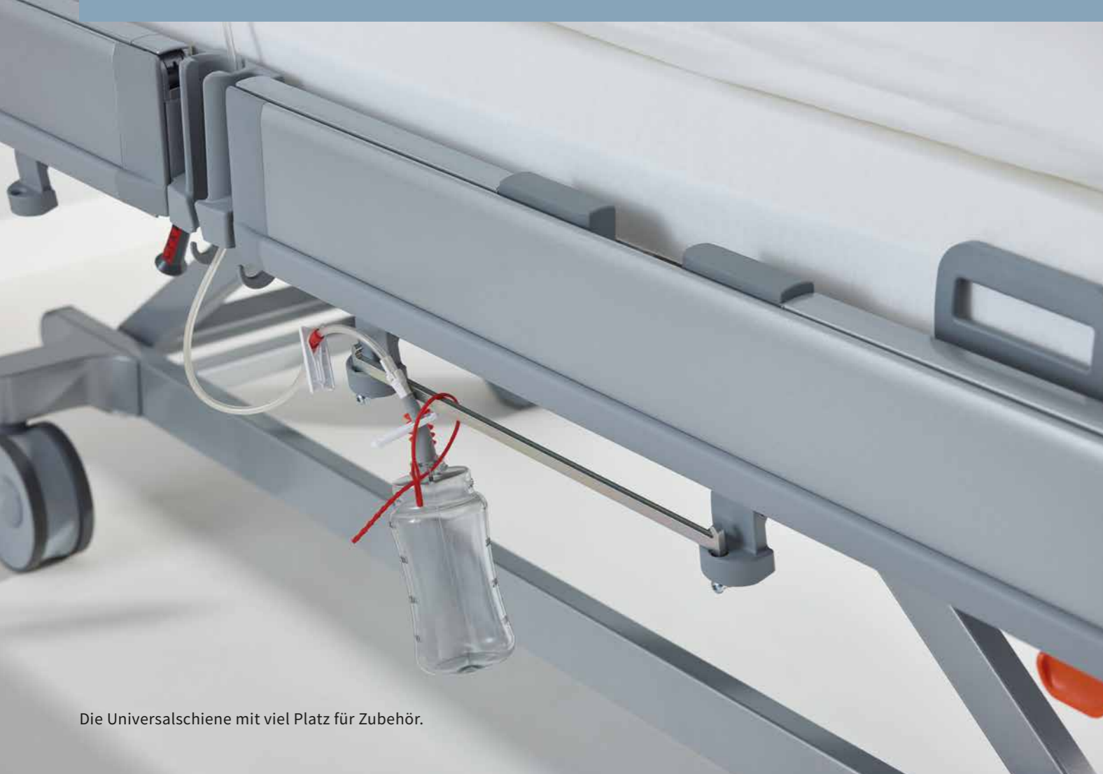
Die Universalschiene mit viel Platz für Zubehör.