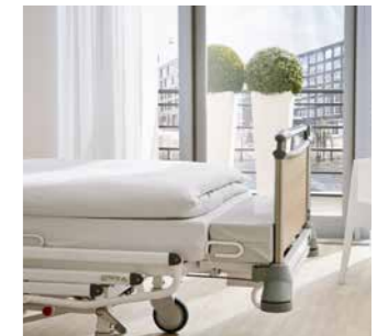
Bettverlängerungen Mehr Platz und Komfort für Patienten