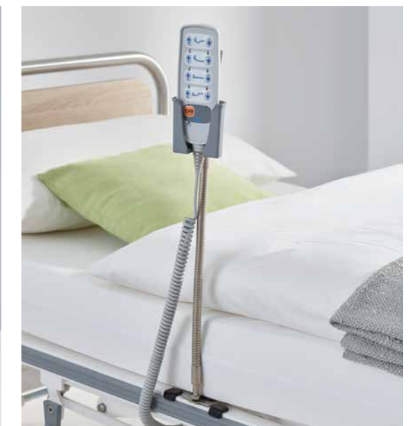
▲ Mit dem biegsamen Geberhalter an der Bettseite ist der Handschalter immer ideal in Griffweite des Patienten.

◀ Mit einem Köcher am Kopf- oder Fußteil kann der LCD-Handschalter in oder außerhalb der unmittelbaren Reichweite des Patienten platziert werden.