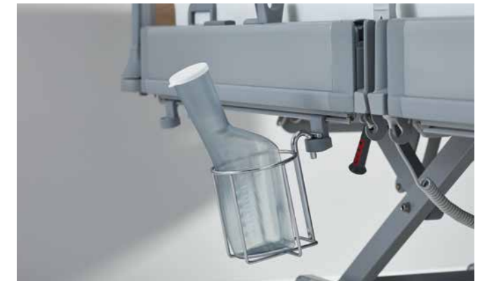
▲ Der Urinflaschenkorb zum Anhängen an der Bettseite.