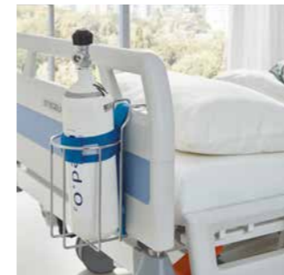
Sicherer Halt für Sauerstoffflaschen