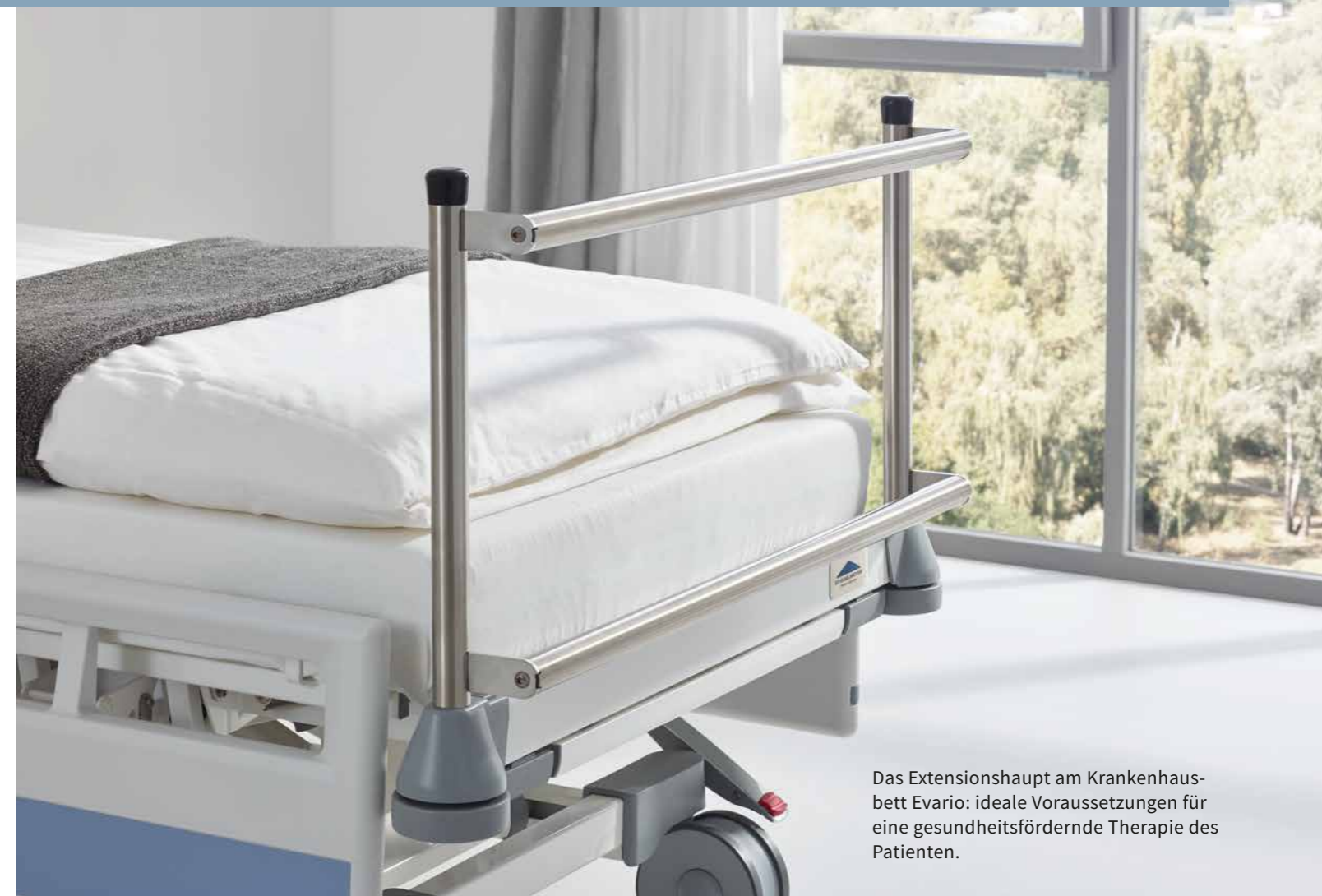
Das Extensionshaupt am Krankenhausbett Evario: ideale Voraussetzungen für eine gesundheitsfördernde Therapie des Patienten.