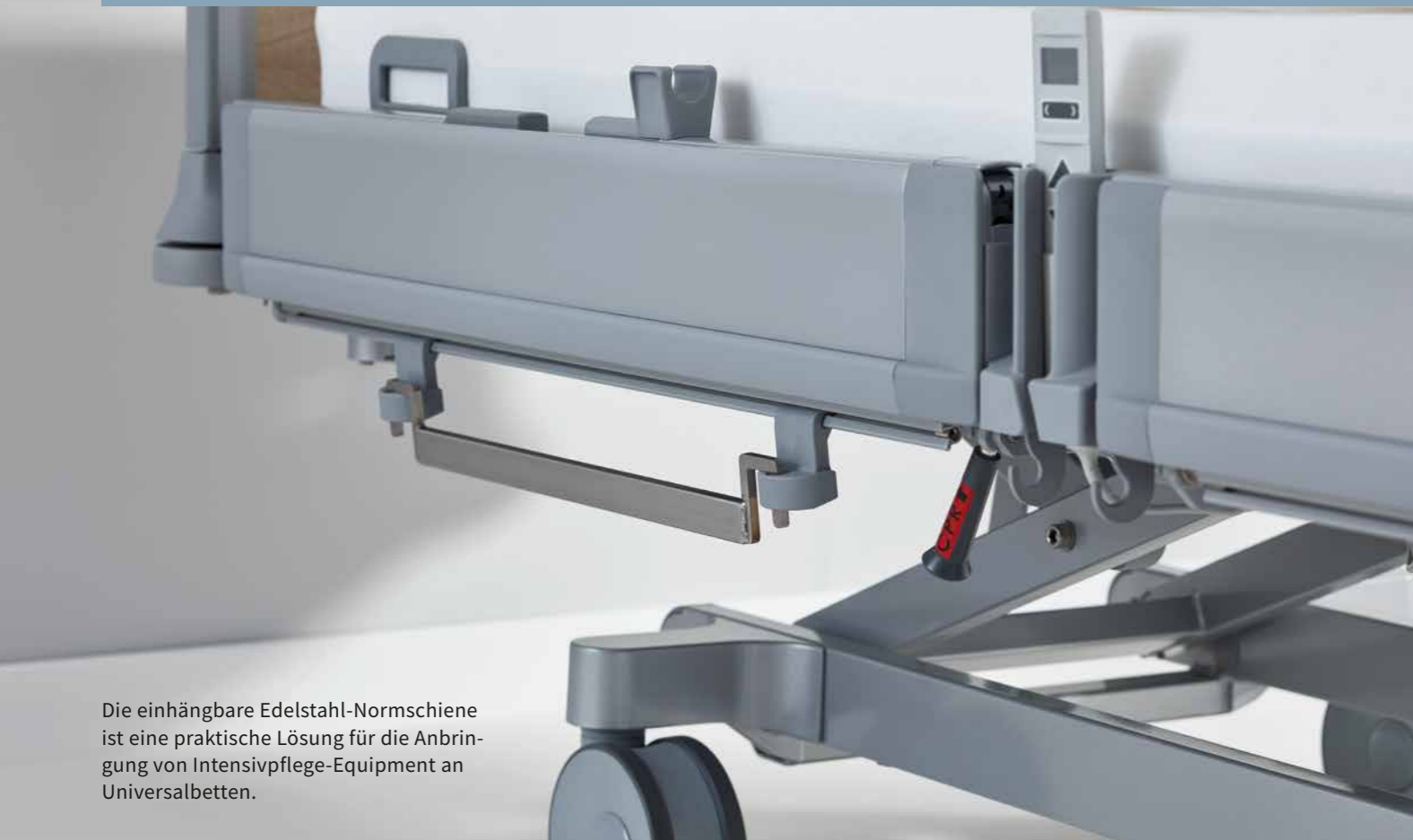
Die einhängbare Edelstahl-Normschiene ist eine praktische Lösung für die Anbringung von Intensivpflege-Equipment an Universalbetten.