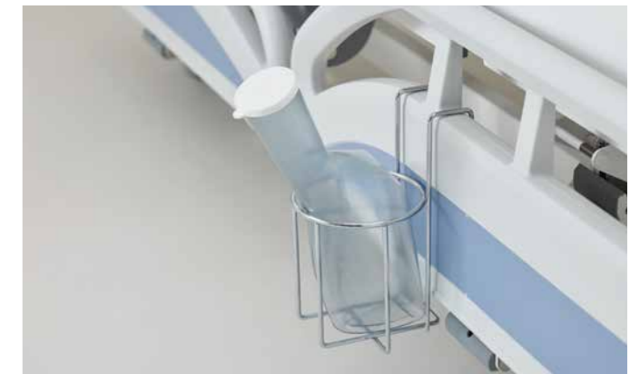
▲ Der Urinflaschenkorb für die Protega-Seitensicherung am Evario.