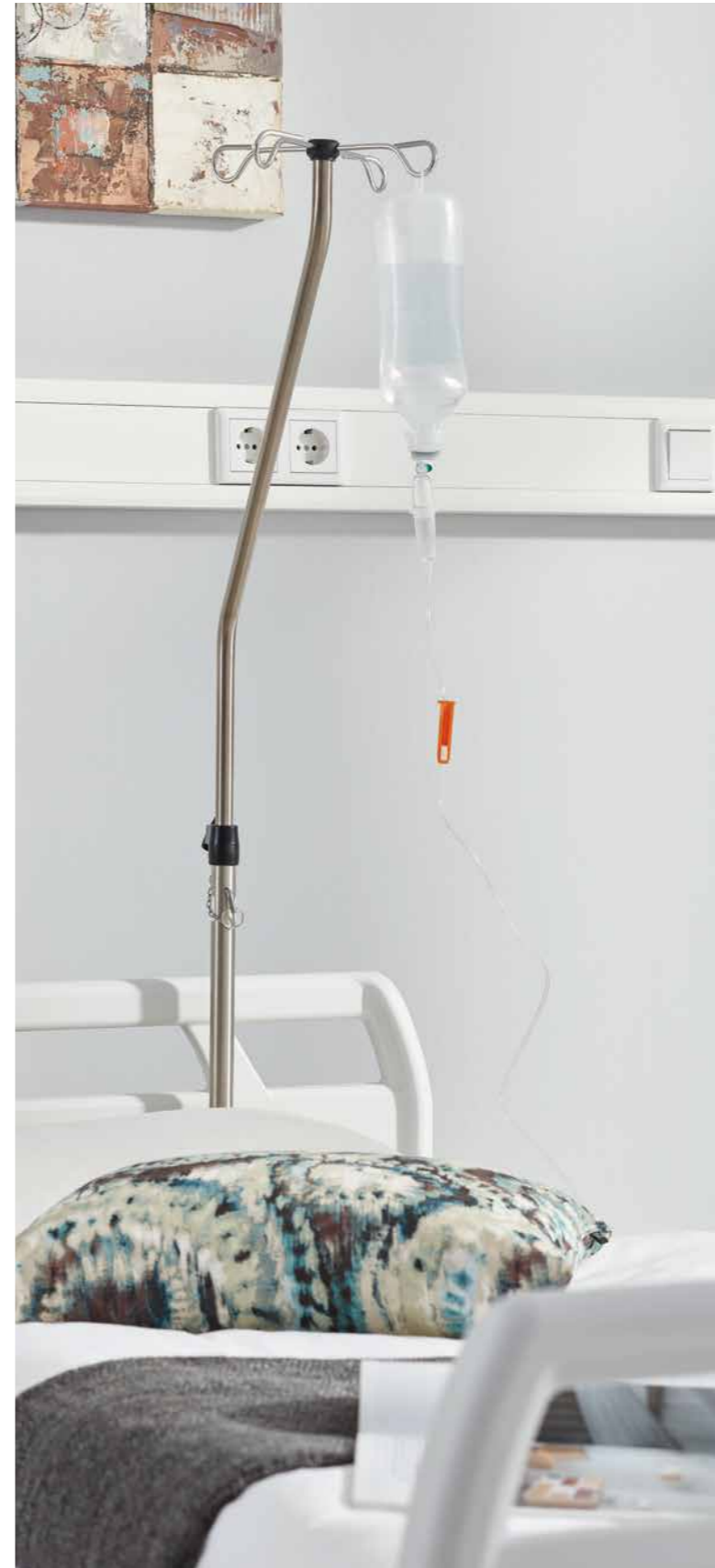
▲ Der Infusionsständer mit 45°-Biegung beugt Kollisionen bei der Verstellung des Bettes vor.