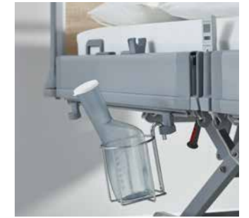
Universalhalterungen und Urinflaschenkörbe