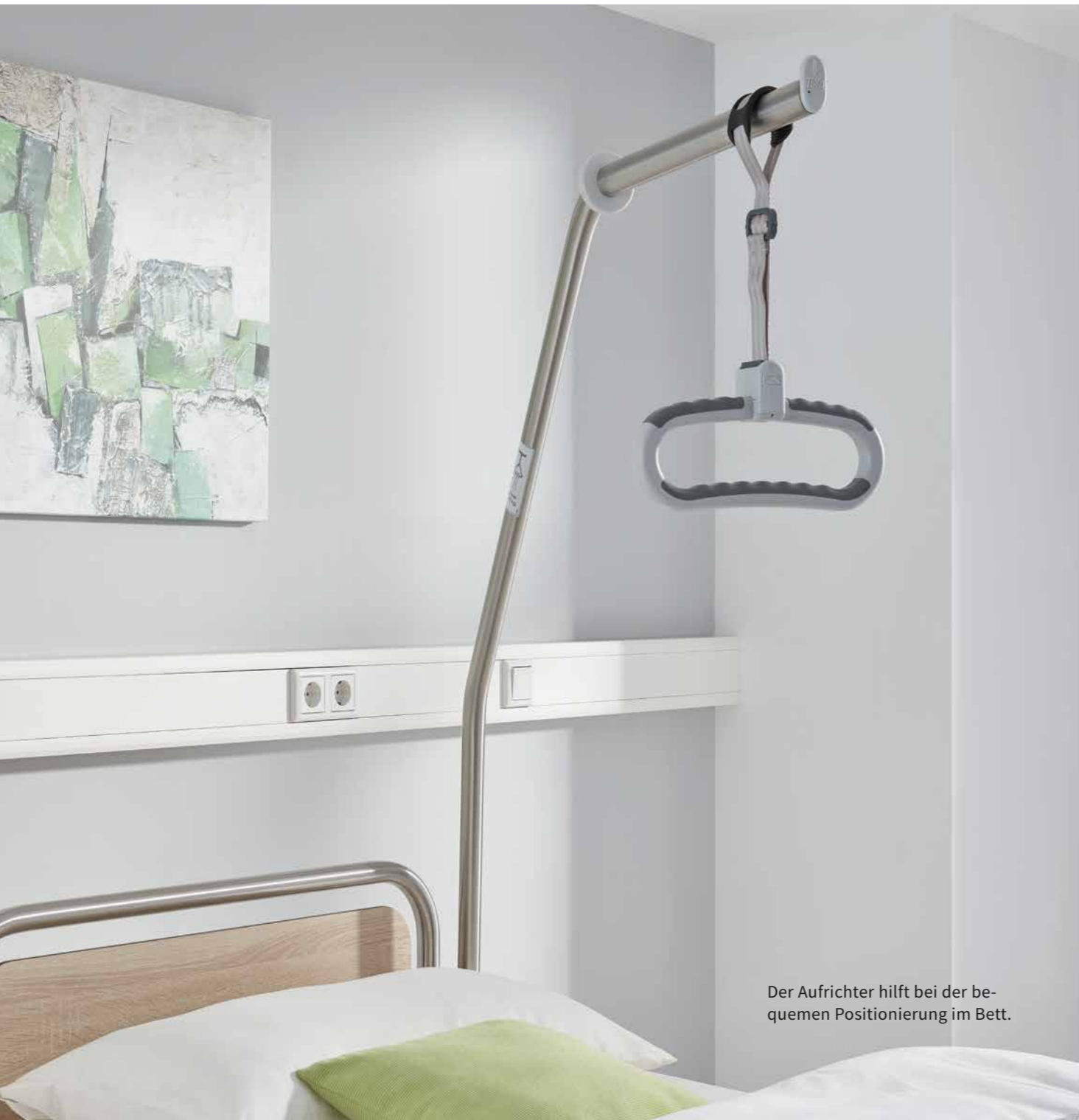
Der Aufrichter hilft bei der bequemen Positionierung im Bett.

Gehhilfen sollten immer griffbereit zur Stelle sein. Unsere praktischen Gehhilfenhalterungen werden einfach an den Kopf- und Fußteilen des Bettes oder an der Reling des Nachttisches angebracht.