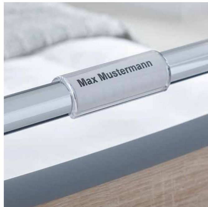
Die Klemmschale für das Namensschild lässt sich flexibel positionieren. ▶

Die Patienten mit Namen ansprechen zu können, schafft Sicherheit und eine vertrauensvolle Atmosphäre und erleichtert die Visite. Unsere Klemmschale für ein Namensschild ist praktisch und hygienisch.