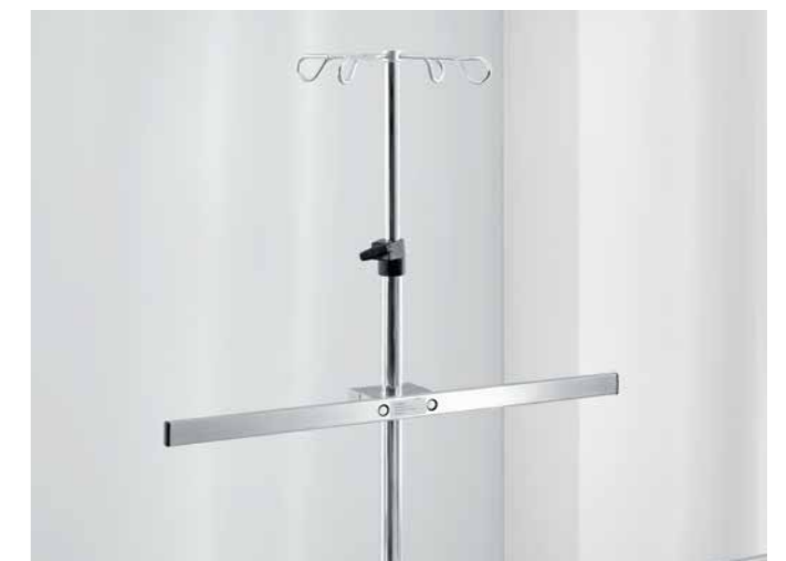
▲ Die Normschiene für den Infusionsständer ermöglicht die platzsparende Positionierung von Zubehör auf Augenhöhe, z. B. Infusionspumpen.