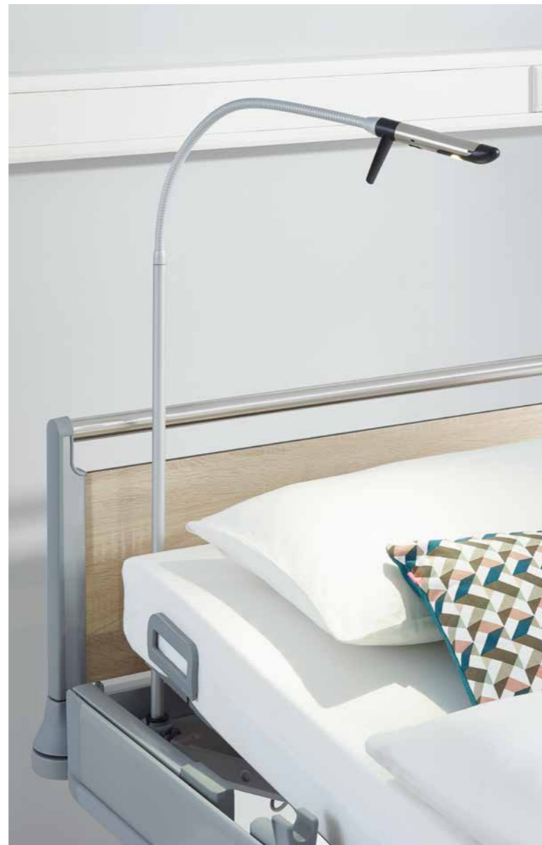
▲ Unsere Leseleuchte Stella spendet den Patienten ein angenehmes, gemütliches Licht – ohne dabei den Bettachbarn zu stören.