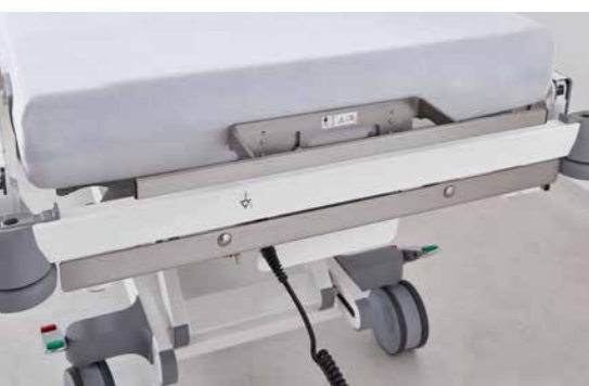
◀ Normschiene an der Rückenlehne.