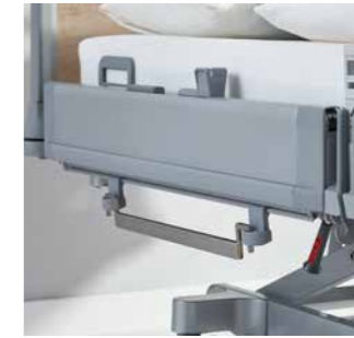
Normschienen für die Intensivpflege