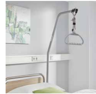
Aufrichter für Komfort und Entlastung

Krankenhausbetten von Stieglmeyer bieten bereits in ihrer Grundausstattung viele Wahlmöglichkeiten. Mit dem passenden Zubehör werden sie zu maßgeschneiderten Wunschbetten, die auf die Bedürfnisse der Patienten eingehen und die Pflegekräfte erheblich entlasten. Im Mittelpunkt stehen dabei die optimale medizinische Versorgung, mehr Sicherheit für die Pflegebedürftigen und eine höhere Lebensqualität im Alltag. Die Zubehöre können auch nachträglich erworben und mühelos an- oder abmontiert werden. Steigern Sie die Außenwirkung Ihres Hauses, verbessern Sie die Versorgung der Patienten und schützen Sie Ihre wertvollen Investitionen.