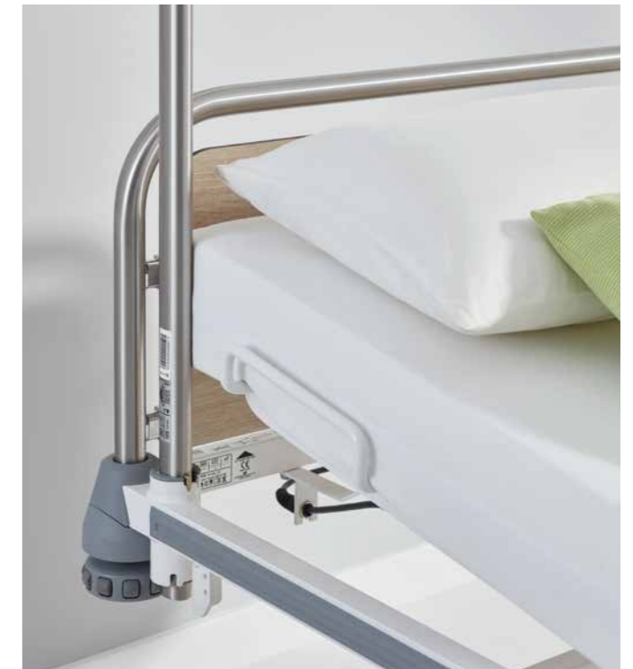
▲ Der Aufrichter kann einfach kopfseitig rechts oder links in die Aufnahmevorrichtungen des Bettes eingesteckt werden.