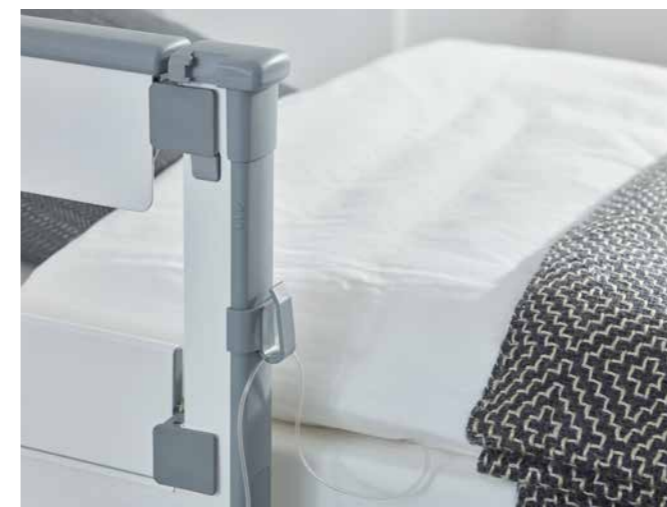
▲ Auch ein Schlauchhalter für die Mobilisierungsstütze der MultiFlex-Seitensicherung ist wählbar.

Unsere Normschiene ermöglichen unter anderem die Positionierung von Drainagebeuteln nahe am Patienten. Um die Drainageschläuche zusätzlich zu sichern, bieten sich praktische Schlauchhalter an. Sie sorgen dafür, dass die Schläuche nicht knicken und geordnet verlegt werden können. Es gibt Halter zur Befestigung an den Griffleisten der Köpfe oder an der Mobilisierungsstütze der MultiFlex-Seitensicherung.