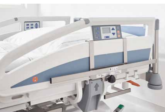
◀ Normschiene an der Protega-Seitensicherung.