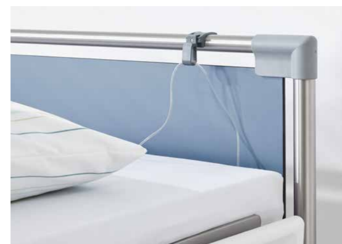
◀ Der Drainageschlauchhalter lässt sich an den Griffleisten der Kopf- und Fußteile befestigen.