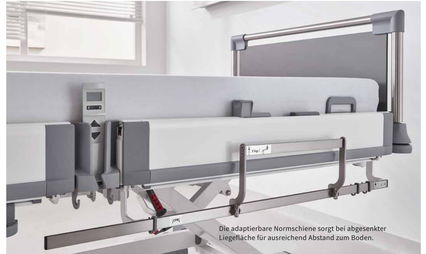
Die adaptierbare Normschiene sorgt bei abgesenkter Liegefläche für ausreichend Abstand zum Boden.