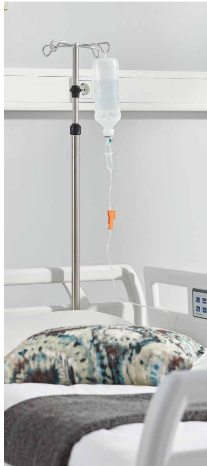
▲ Der senkrechte Infusionsständer ist die klassische Standardlösung.