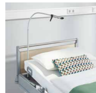
Leuchten direkt am Bett