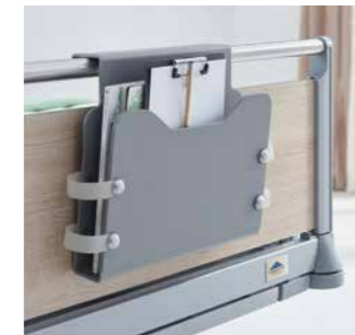
Zubehör am Fußteil immer aktuell und griffbereit