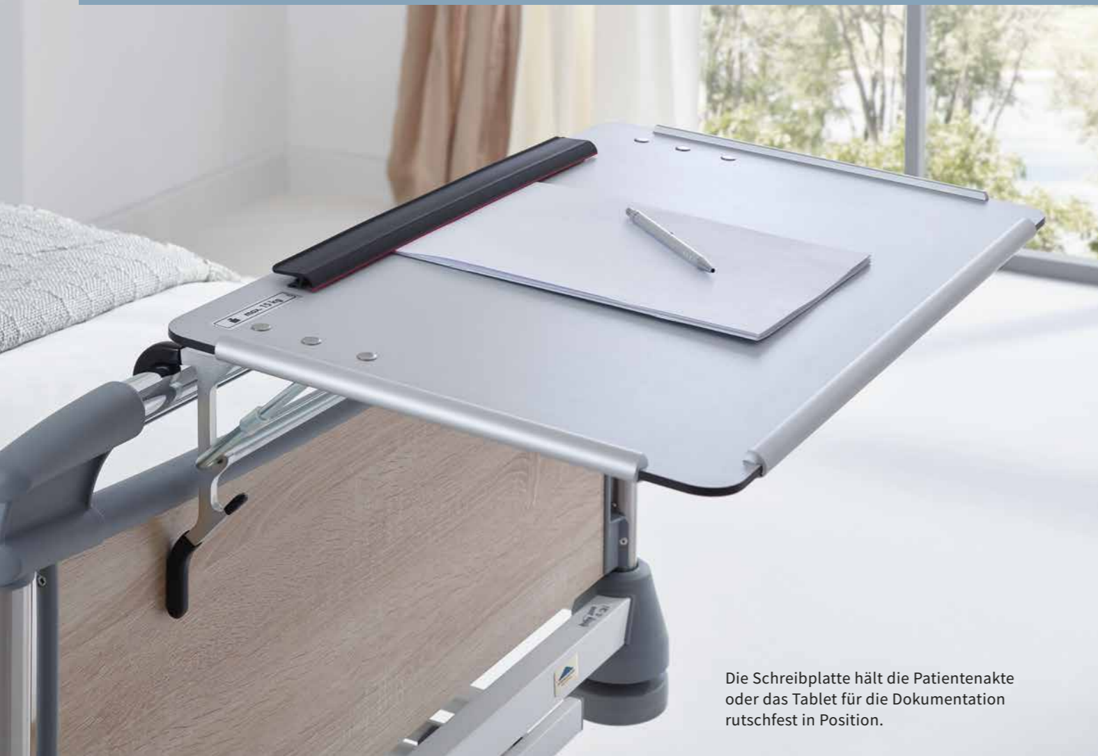
Die Schreibplatte hält die Patientenakte oder das Tablet für die Dokumentation rutschfest in Position.