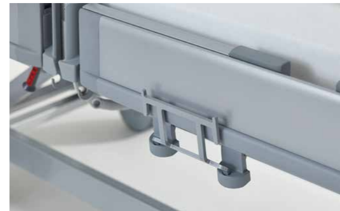
▲ Der Universalhalter am Klinikbett Puro mit flexiblen Montagehöhen für die tief absenkbare Liegefläche.

Urinflaschen sollten im Bedarfsfall schnell griffbereit und sicher vor dem Kippen geschützt sein. Unsere Urinflaschenkörbe erfüllen diese Anforderungen optimal. Wir bieten Modelle mit maßgeschneiderten Halterungen für verschiedene Klinikbetten und Ausstattungen an – zum Beispiel für die MultiFlex + -Seitensicherung an unserem Puro oder die Seitensicherung Protega am Evario.