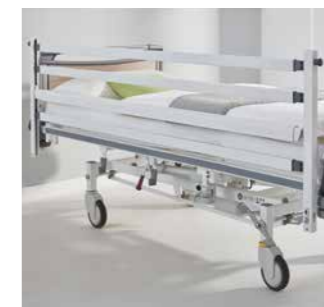
Seitensicherungen für maximalen Schutz