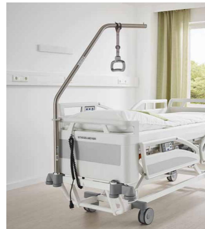
▲ Aufrichter am Evario mit festem Kopfteil.