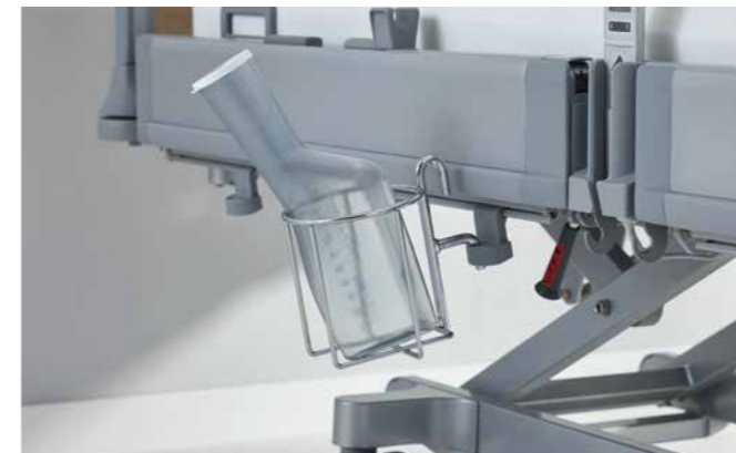
▲ Der Urinflaschenkorb für die MultiFlex + -Seitensicherung des Puro mit flexiblen Montagehöhen für die tief absenkbare Liegefläche.