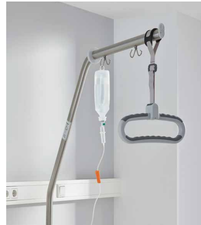
▲ Doppelhaken für Infusionen ermöglichen die sichere Versorgung des Patienten. Der Softtouch-Haltegriff ist besonders rutschfest.