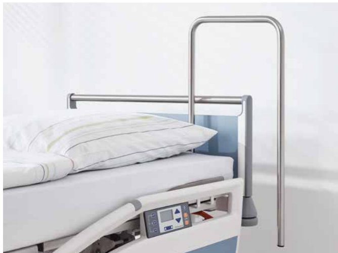
▲ Der Haltebügel eignet sich für den Einsatz auf der Intensivstation.

Ist am Bett ein Aufrichter vorhanden, lässt sich daran ein Infusionshalter mit 4 Haken selbstverriegelnd befestigen. Für unseren Stretcher Mobilo steht ein 2-fach teleskopierbarer Infusionsständer zur Verfügung, der an allen 4 Ecken befestigt und bei Nichtgebrauch mithilfe einer optionalen Halterung am Fußende verstaut werden kann. Dank seiner schwenkbaren Haken benötigt er dort nur wenig Platz. Für die Intensivstation eignet sich besonders der stabile Haltebügel , an dem medizinische Ausrüstung sicher befestigt werden kann.