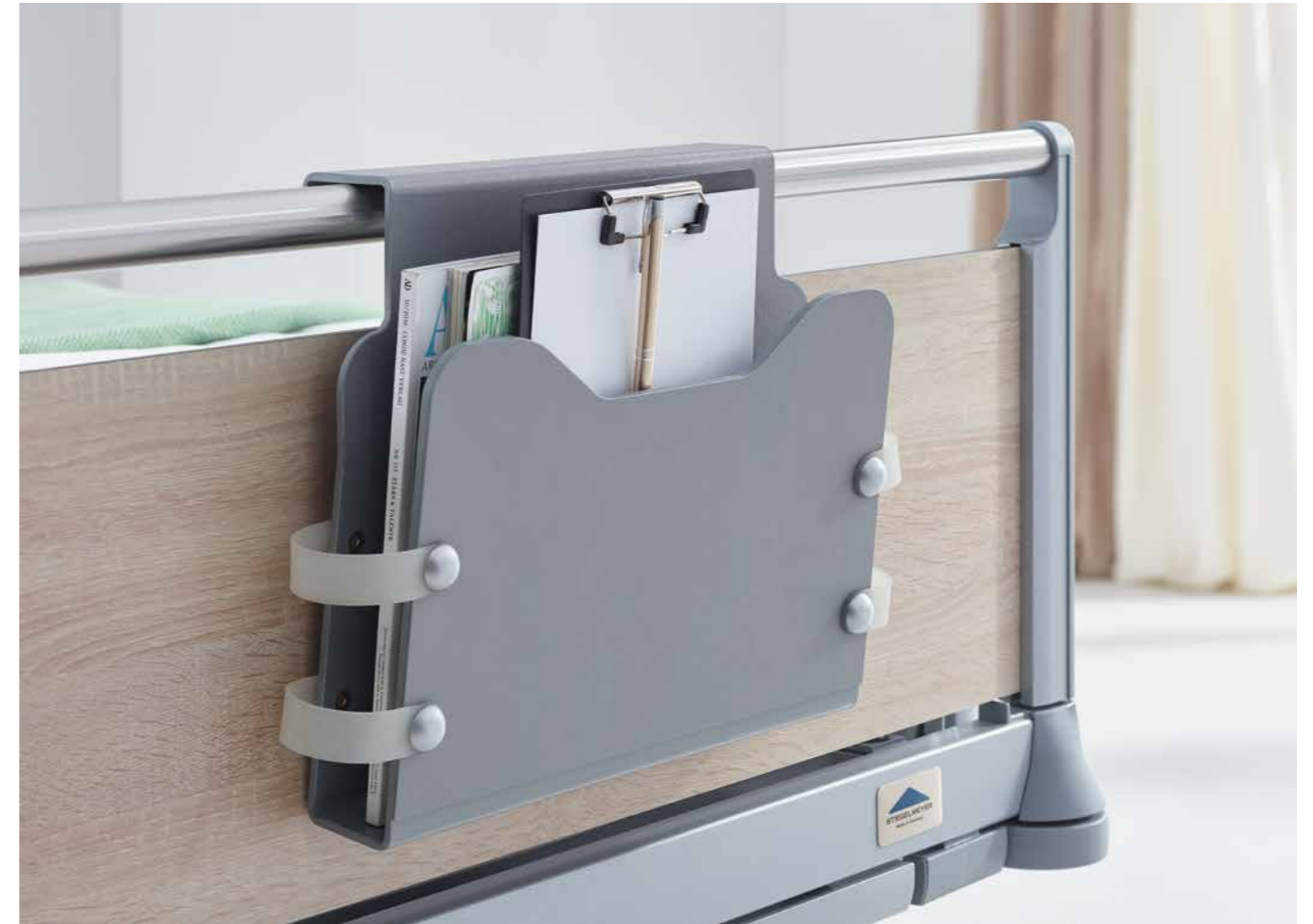
▲ Die Dokumentenhalterung im modernen Farbton Argentum passt gut zu jedem Bett.