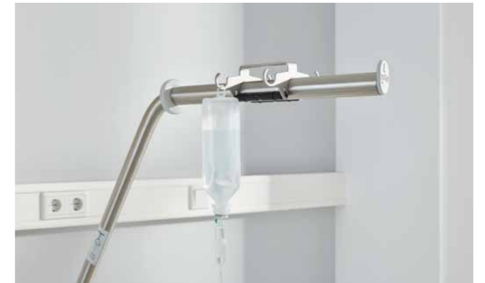
▲ Der Infusionshalter mit 4 Haken lässt sich am Aufrichter befestigen