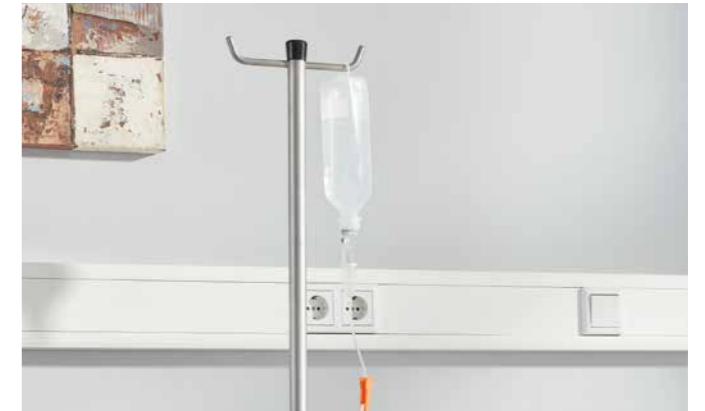
▲ Der Schwerlast-Infusionsstab trägt Lasten von bis zu 10 kg pro Haken.