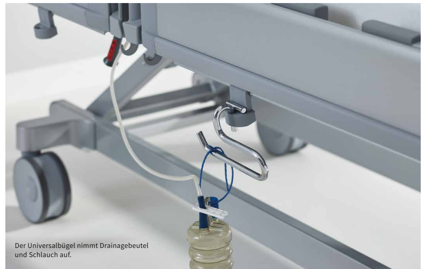
Der Universalbügel nimmt Drainagebeutel und Schlauch auf.