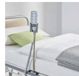
Handschalter immer in Griffnähe