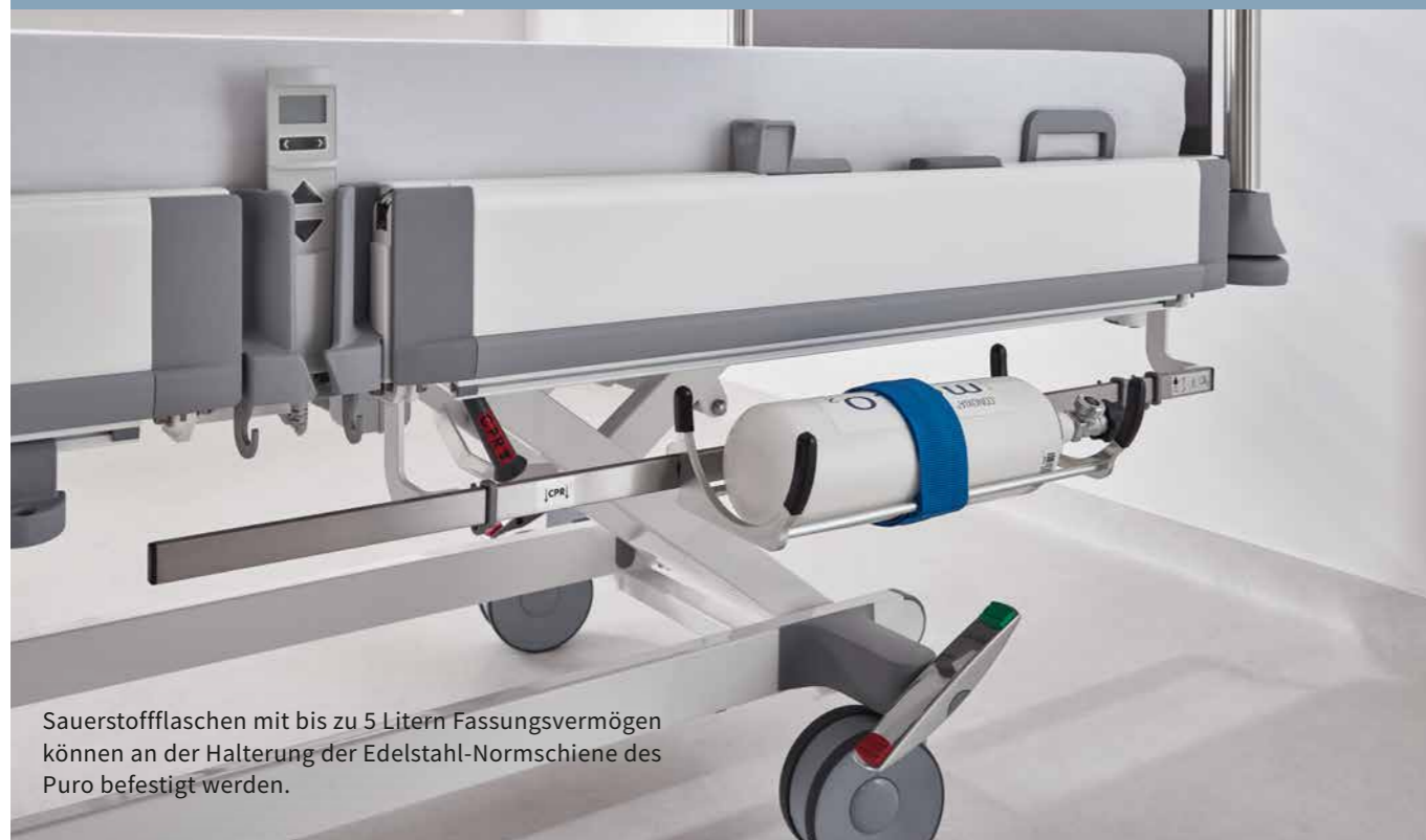
Sauerstoffflaschen mit bis zu 5 Litern Fassungsvermögen können an der Halterung der Edelstahl-Normschiene des Puro befestigt werden.