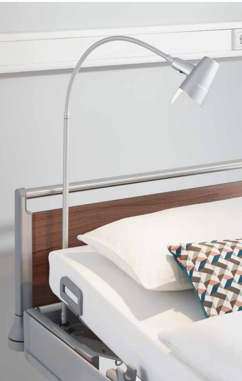
▲ Die Leuchte Sola besitzt einen ansprechend geformten Lampenkopf aus bruchsicherem Kunststoff.

Die LED-Leseleuchte Stella verbindet hochwertiges Design mit einer langen Lebensdauer. Der Leuchtenkopf ist aus hochglanzpoliertem Edelstahl und bietet ein Nacht-Orientierungslicht. Das Modell Stella ist auch in einer Variante zur Anbringung am Nachttisch verfügbar.