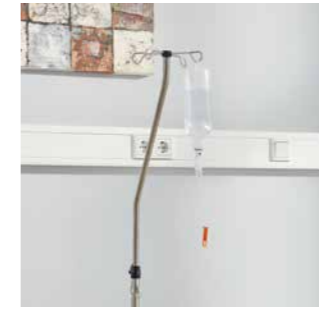
Infusionsständer für eine sichere Versorgung