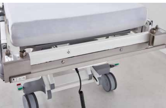
◀ Normschiene am Rahmen (kopfsseitig).