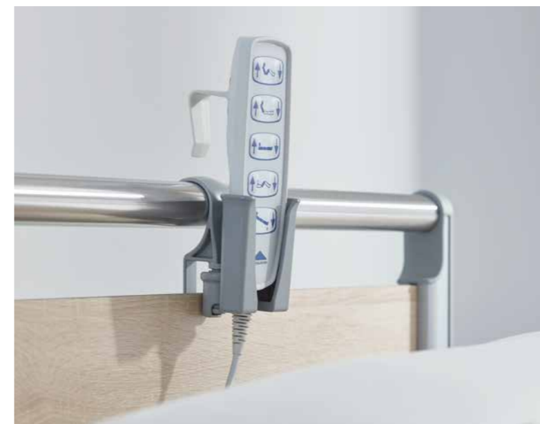
▲ Auch für den Standardhandschalter gibt es einen maßgeschneiderten Köcher.

Handschalter sollen für Patienten und Pflegekräfte immer griffbereit sein. Zugleich sollen sie am Bett sicher aufbewahrt werden können, um Beschädigungen vorzubeugen. Klinikbetten von Stieglmeyer bieten bereits serienmäßig praktische Befestigungsmöglichkeiten.