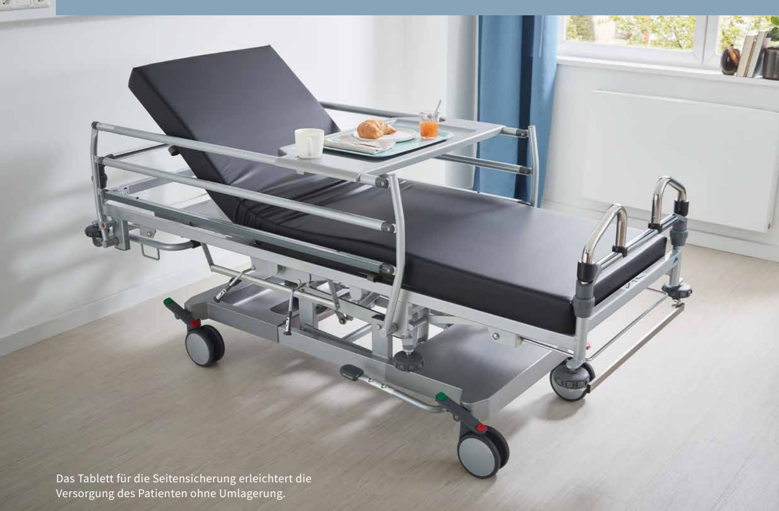
Das Tablett für die Seitensicherung erleichtert die Versorgung des Patienten ohne Umlagerung.