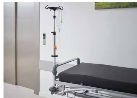
▲ Die optional erhältlichen Infusionsständer sind 2-fach teleskopierbar und können an allen 4 Ecken des Stretchers montiert werden.

Alle zur Behandlung notwendigen Versorgungselemente können leicht, sicher und schnell am Mobilo installiert werden. Dadurch lassen sich die Nutzungsmöglichkeiten als Stretcher oder Tagesliege flexibel ausschöpfen.